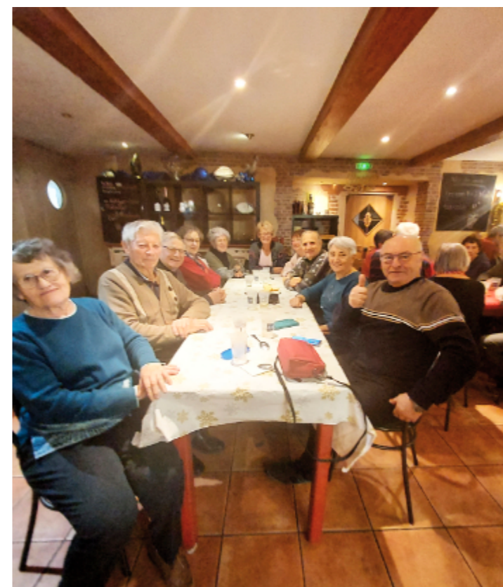
Un moment convivial pour nos aînés

Les journées ont bénéficié du soutien de trois formateurs du club de sauvetage toulousain, affilié à la fédération française de sauvetage et de secourisme (FFSS). Le samedi après-midi, une trentaine d'habitants du village ont participé à des sessions de sensibilisation portant sur l'appel aux urgences et les gestes de premiers secours à prodiguer aux