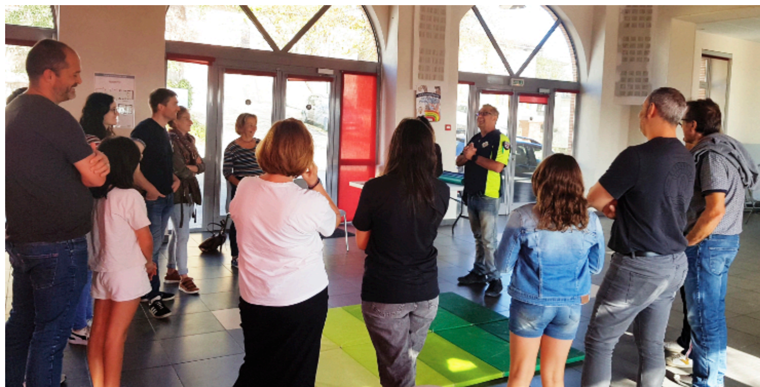
Une trentaine de personnes ont pu bénéficier d'une sensibilisation aux gestes qui sauvent