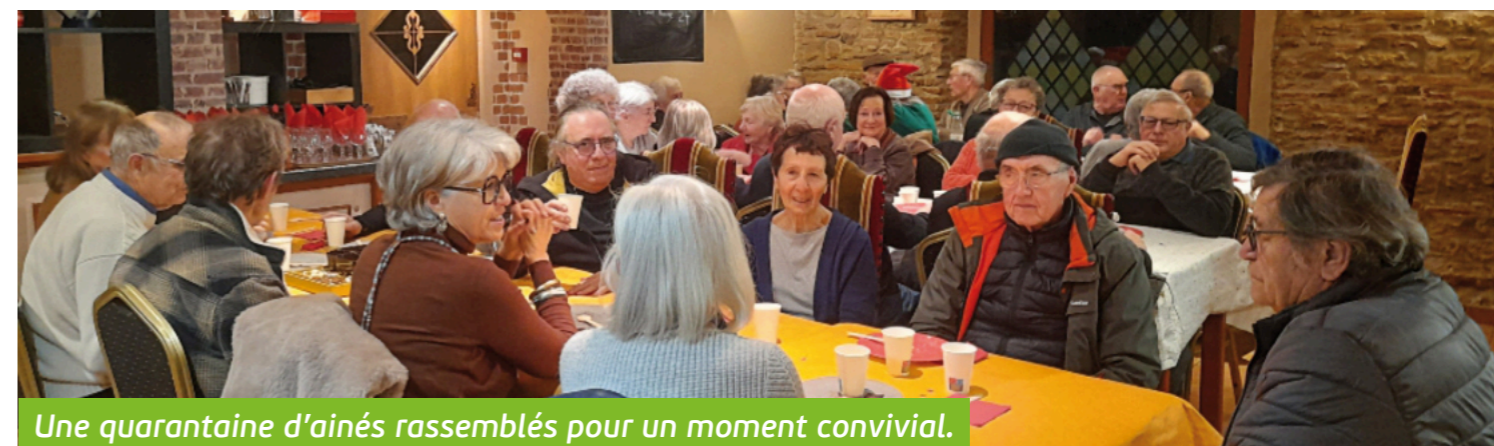
Une quarantaine d'aînés rassemblés pour un moment convivial.

Le 18 décembre 2024 les aînés étaient invités à se réunir pour une collation à la taverne le Relais Montgaillard. Nombreux à répondre à l'invitation, ils étaient plus de quarante à participer à cet événement organisé par le CCAS centre communal d'action social. Nous remercions Gérard et son équipe pour leur accueil chaleureux et la mise à disposition gracieuse des locaux. À cette occasion les aînés présents ont pu récupérer leur colis de Noël préparé par la conserverie du Lauragais qui une fois de plus a assuré une prestation de qualité. Les aînés absents ont pu recevoir à leur domicile les colis livrés par les membres du CCAS. Nous les remercions pour leur accueil chaleureux. Le CCAS prépare, en partenariat avec l'école communale, une